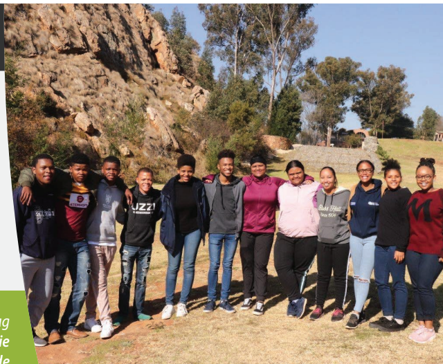
Studente wat studiebeurse ontvang het, was onlangs by 'n werkwinkel om hulle vir die werkplek voor te berei.

Altesaam ses leerlinge van die Umoya Energy-windkragaanleg se studiebeursprogram het die werkwinkel bygewoon. Die studente sê hulle is opgewonde oor die belangrike lesse wat hulle geleer het.