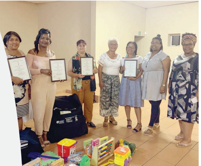
Speelgroep-mentors en afrigters het sertifikate tydens 'n onlangse gemeenskapsvergadering ontvang.

Ons is bly om aan te kondig dat Grassroots sal voortgaan om skoolgereedheid in die gemeenskap te verbeter deur middel van hul vroeëkindertwikkelingsprogramme, mentorskap en opleiding.