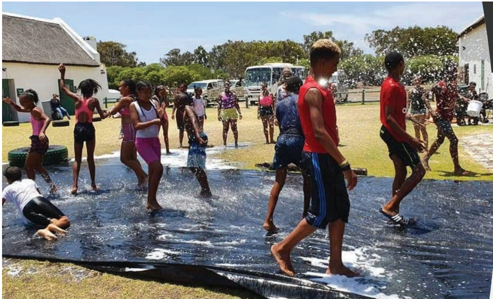
Pret by die Whole of Society Approach-vakansieprogram.